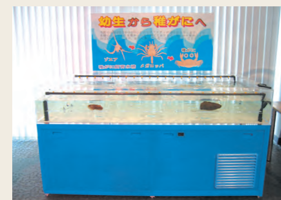
越前がにふ化水槽

今回は、越前町民に限り5月末まで入館料を割引しますので、来館時には受付へ申し出て下さい。