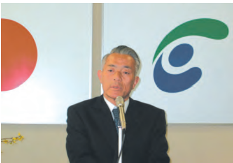
職員に訓示する町長

町民のみなさんの特段のご支援とご協力を賜りますよう、切にお願い申し上げます、就任のごあいさついたします。