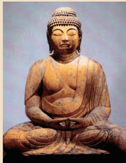
阿弥陀如来坐像 (国指定重要文化財)

また、八坂神社には数多くの貴重な仏像があります。昭和三十八年、旧社殿を取り壊す際に、主神奉祀の床壇下から偶然、多くの仏像が発見され、その後、関係者の努力によって修理がなされました。現在は収蔵庫で拝観することができません。仏像は平安から鎌倉時代の作で、祇園天王宮を中心とした寺社の本尊であったといわれています。中でも阿弥陀如来坐像と釈迦如来坐像を含めた四体の仏像と木造光背は国の重要文化財に指定されています。 先人たちがこれらの仏像を苦勞して守ってきたように、私たちもこれを受け継ぎ、後世に残していかなければなりません。