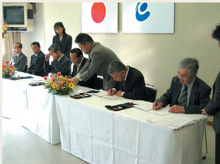
各土地改良区の理事長による調印

今後は、各土地改良区の総会や総代会での議決、県の認可を経て平成17年11月30日には正式に合併される予定です。