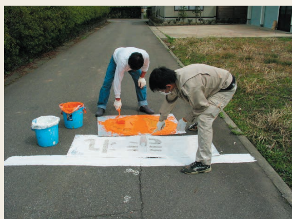
交差点ではしっかり止まって安全確認を…