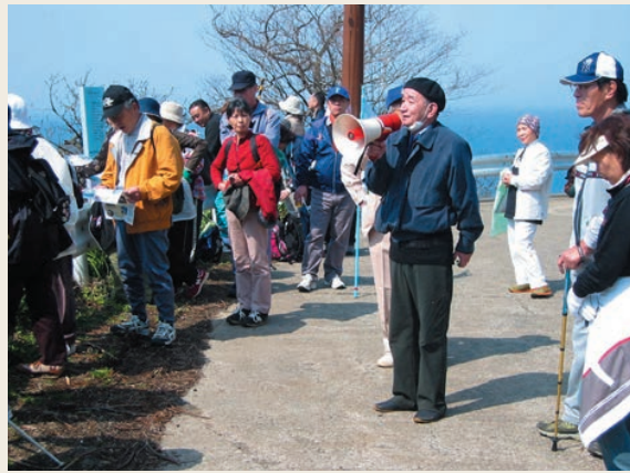
越前かたりべのガイドに耳をかたむけている参加者

また、町商工会や町観光協会のみなさんが参加者に海の幸たっぷりの「ととだし鍋」をふるまいました。