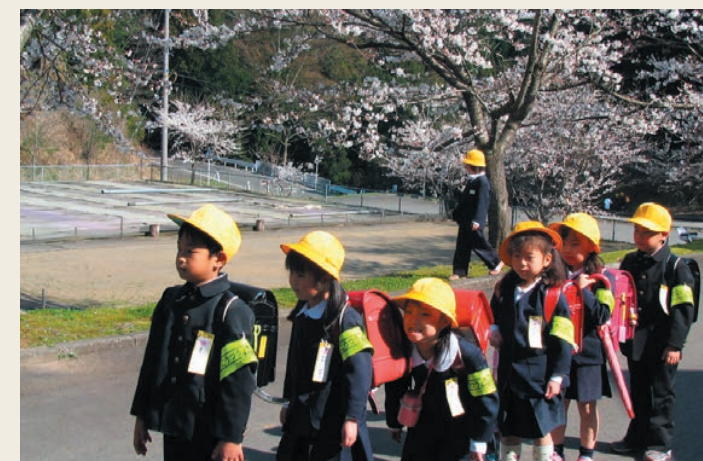
贈られたグッズを着けて、登下校しています。

また、近年登下校中の子どもを狙った犯罪が多発していることから、福井エフエム放送から児童たちに防犯ブザーが贈られました。同社は、開局二十周年を記念し、昨年からの防犯ブザーを贈るキャンペーンを展開しています。