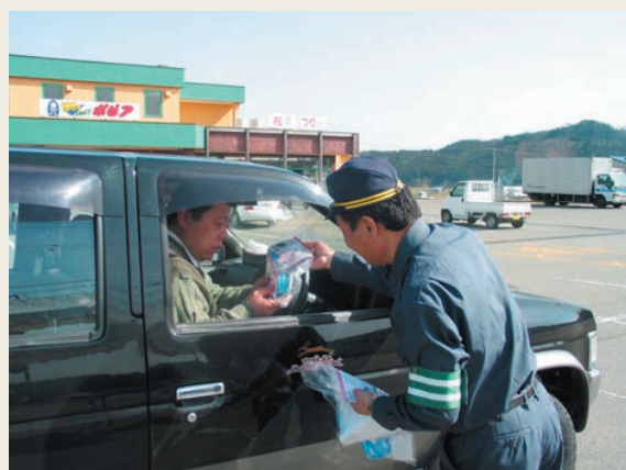
「安全運転をお願いします!!」

また、各学校でも飛び出しや自転車による事故を防ぐため、交通安全教室が行われ、生徒たちは丹生署交通巡視員や町交通指導員の話に熱心に耳を傾け、取り組んでいました。