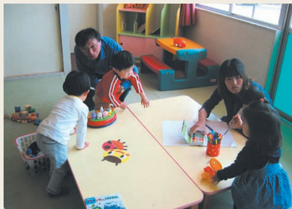
子どもたちの遊具を備え、親たちは安心して情報交換ができます。

開所日 月曜日～金曜日（土・日・祝祭日・年末年始は休所） 利用時間 午前9時～正午 問合せ先 織田子育て支援センター ☎ 36-2232 （旧 織田保育所）