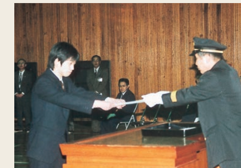
辞令を受け取る新入団員