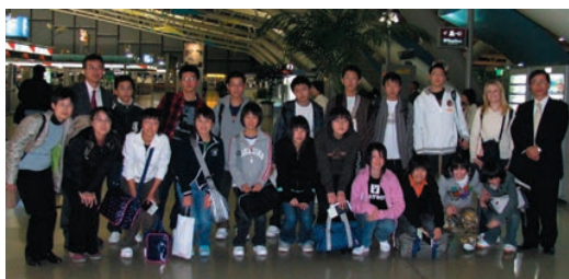
出発前の交流参加者