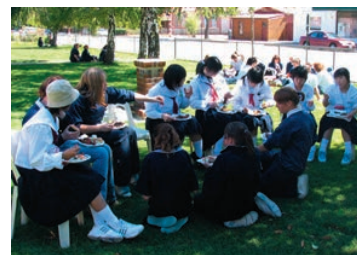
現地中学生との交流