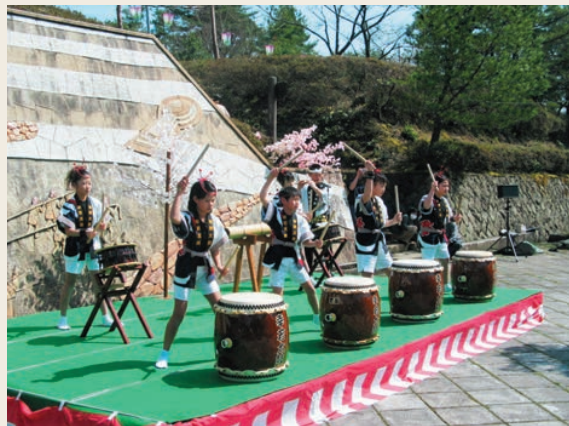
威勢よく太鼓を叩く子どもたち

4月8日・9日、古墳公園花まつりが開催され、大勢の人でにぎわいました。このイベントは、朝日町観光協会が毎年開いており、今年は合併をPRしようと「子ども太鼓の競演」が企画され、幸若子ども太鼓、越前陶芸太鼓保存会、明神ばやし保存会の3団体が出演しました。子どもたちの元気いっぱいのはちさばきに、訪れた人から盛んな拍手が送られていました。また、焼き鳥やたこ焼きなどのバザー、子どもゲームコーナーも盛況で、咲き始めた桜を鑑賞しながら楽しいひとときを過ごしていました。