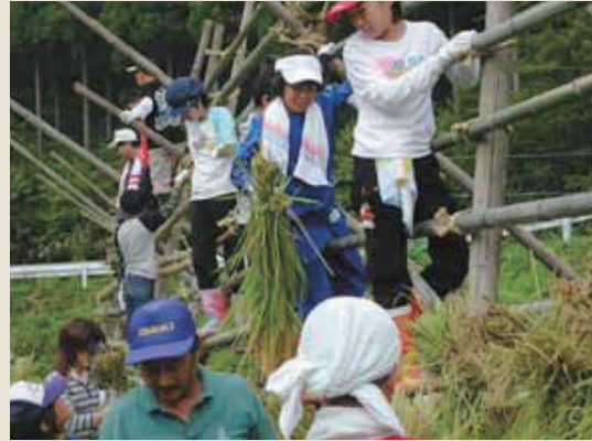
はさばに登り、稲を掛ける子どもたち