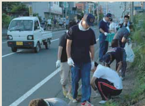
清掃作業で道路は大変きれいになりました

職員厚生会では、毎年管内で清掃奉仕活動に取り組んでおり、今年は織田地区で行われ、両日とも、約2時間かけて、国道365号の織田バスターミナルから下河原の交差点までの区間、県道ミ拾いや草むしりなどを行いました。