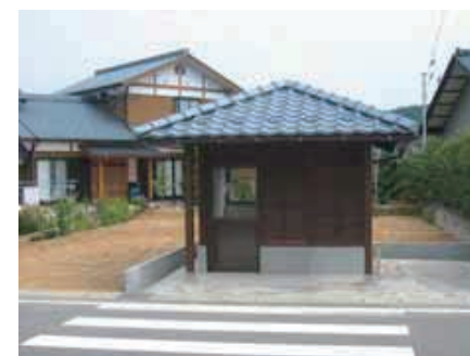
平成17年8月に完成した下糸生区のごみステーション