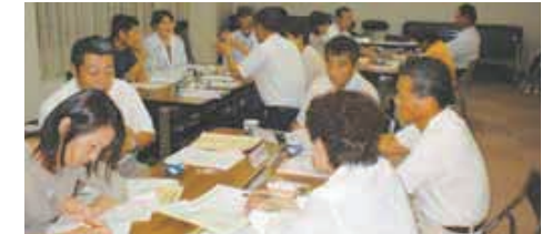
活発に意見が飛び交う部会

お待ちしております。各地区の推進員または男女共同参画室へ気軽に問い合わせください。