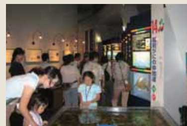
越前町にはこんなところがあるんだ!

商工観光課では、冬にも同様のツアーを企画しています。町民のみなさん、ぜひ参加してください。