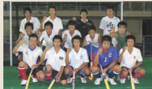
少年男子ホッケーチーム。優勝目指してガンバレ!!