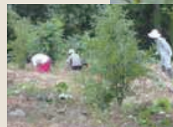
どんぐりがしっかり実りました