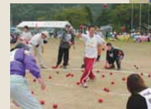
玉ちゃんファイト