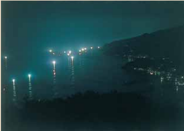
高台から漁火を臨む

夕刻時に見られる越前海岸の夕陽も絶景ですが、夜になるとまた違った姿を現します。眩しいくらい「漁火」が、越前沖一体を明々と照らします。漁火とは、夜、魚を誘い寄せるために船の上で焚く火を意味します。漁火を演出している光源の正体は、主にイカ釣り船です。大きな電球をいくつも照らし、船の周囲にイカを集めます。夜間に船の上から明かりを照らしてイカ