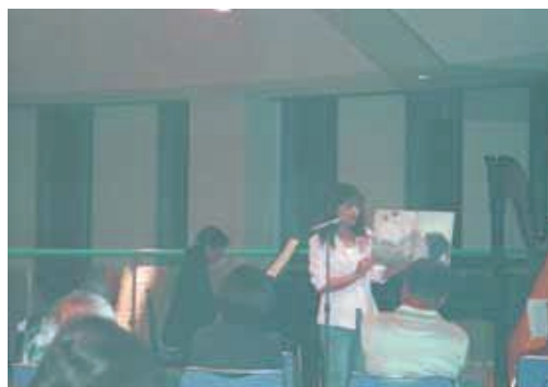
9月4日、越前町立図書館で、ピアノ、ハープ、フルートの美しい演奏と、素敵な読み語りのコンサートが行われました。

とき 10月22日 12月3日 ところ 越前町立図書館(西田中) 問合せ先 34-0395