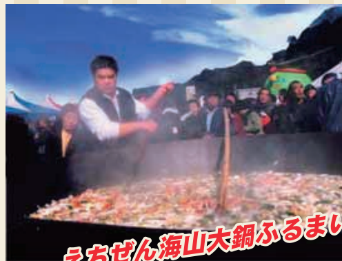
えちぜん海山大鍋ふるまい

とき 10月15日(土) 9:30~16:00 10月16日(日) 10:00~16:00 ところ 越前町役場前駐車場