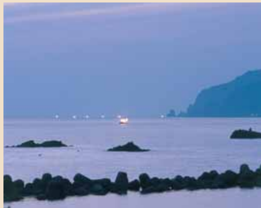
越前の夜の海を漁火が演出します

を集める方法は、電球などなかった時代から、かがり火やランプを使って行われていたそうです。静かな海に浮かぶ幻想的な光景は、誰もが見入ってしまうのではないのでしょうか。