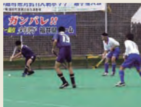
パスをつないで、目指せゴール! (福井県男子チーム)