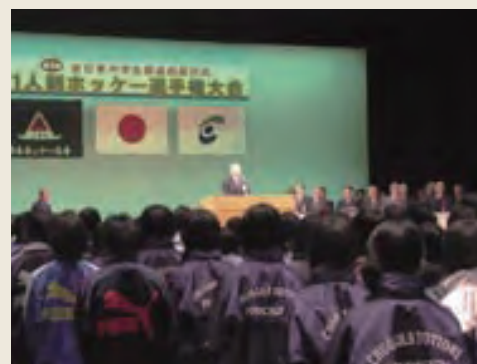
開会式で挨拶する関町長