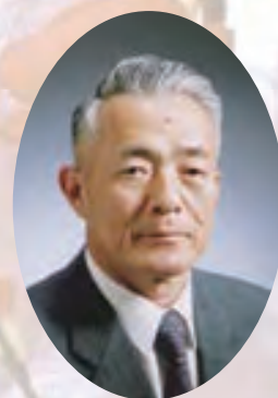
越前町長 関 敬 信