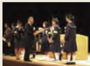
関町長より表彰を受ける入賞者