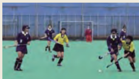
速攻で相手を突破! (福井県女子チーム)