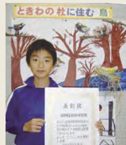
「すばらしい自然を残すためにこれからもがんばります」

常磐小学校は、約20年前から、通学路のゴミ拾いや街頭の清掃奉仕、天王川の清掃など環境美化活動を行っています。また、学校周辺の自然環境を生かし野鳥の観察や巣箱作りを行うなど、自然保護活動にも積極的に取り組んでいることが認められ、今回の受賞となりました。