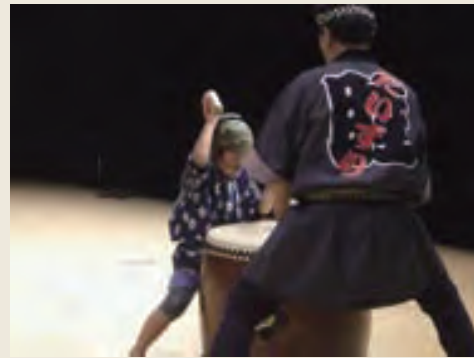
地区に伝わる伝統芸能の発表

また、朝日勤労者体育館では越前町子ども会を主体とした「子どもまつり」が行われ、町内の子供たちが様々な遊びを通じて交流を深め、地元の野菜がたっぷり入った越前鍋や焼そばと一緒に食べながらまつりを楽しみました。