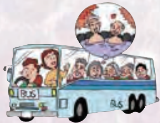
越前町福祉バスに関する意見 (越前町公共交通アンケート調査より抜粋)