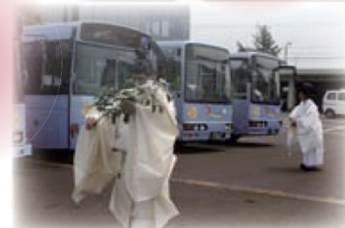
事故のないよう安全祈願

(※)〔公共交通割引カード及び生活路線バス運賃補助券の申請・発行(交付)業務窓口〕