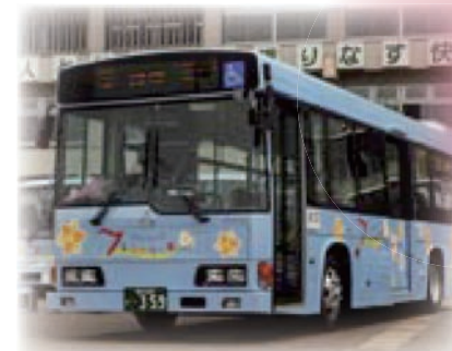
それぞれのルートへ出発!