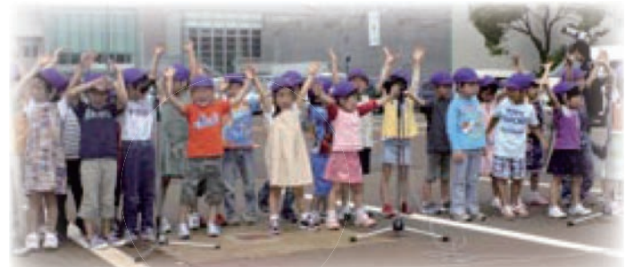
園児30人によるバスの歌