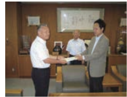
答申書を提出する審議会会長・副会長

この度、9月13日の審議会から町長への答申、9月22日の議会定例会における議会の議決を経て、「越前町総合振興計画」を策定しました。