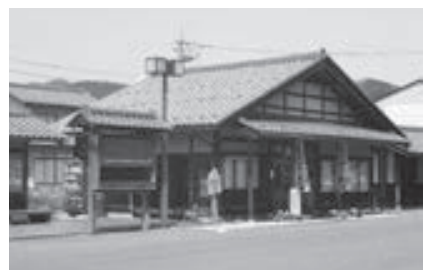
▲花の茶屋「よって駅ね」