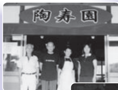
陶寿園で働くスタッフ

まだまだスタートしたばかりですが、ご利用の皆さんに心身ともにくつろいでいただき、満足してもらえるよう更なるサービスの向上に努め、スタッフ一同、皆さんのお越しをお待ちしております。