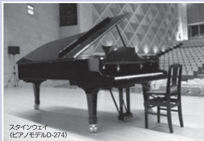
スタインウェイ (ピアノモデルD-274)