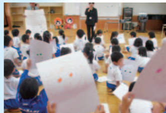
まもる君、かけたよ！