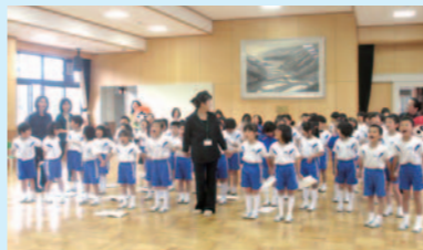
みんなで手をつなぎ、元気よく歌いました