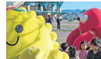
▲開票の結果、越前市のきくりんが3連覇。大差に泡を吹きそうな表情のかに太郎氏