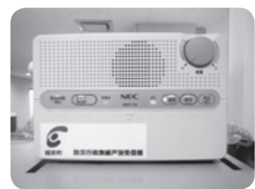
戸別受信機(録音機能付き)

戸別受信機は屋内の壁面へ、屋外アンテナ(ダイポールアンテナまたは三素子八木アンテナ)は屋外の壁面への取り付けが基本となります。