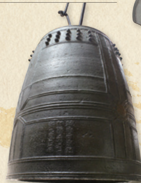
▲国宝・梵鐘 (観神社蔵)