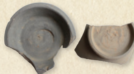
▲墨書土器 (大谷寺蔵)