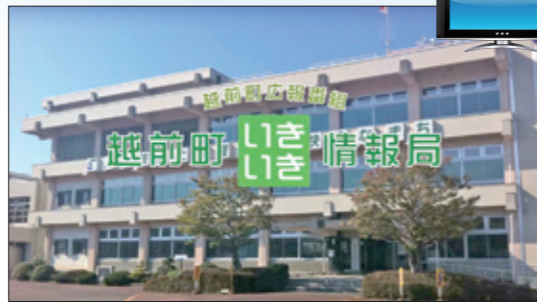
丹南ケーブルテレビ「いきいき情報局」

丹南ケーブルテレビでは、行政情報番組「いきいき情報局」を放送しています。内容は、2週間に1回更新し、1日3回放送しています。