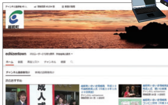
越前町公式動画チャンネル

丹南ケーブルテレビでは、行政情報番組「いきいき情報局」を放送しています。内容は、2週間に1回更新し、1日3回放送しています。