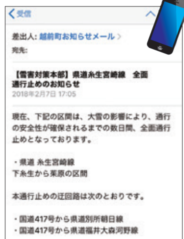
越前町お知らせメール

町の防災情報や緊急性の高い情報は、「お知らせ配信メール」で町民のみなさんの携帯電話に情報を配信します。