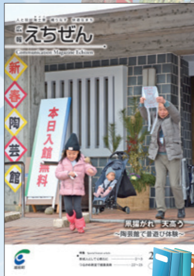
広報誌「広報えちぜん」

広報担当者が、町の「広報」に関する情報をみなさんにお届けする見聞録。最終回は、町の様々な広報手段をまとめてご紹介します。町の広報といえば、みなさんはやはり「広報えちぜん」が一番に思い浮かべるのではないのでしょうか。広報えちぜんは、平成17年2月の4町村合併時に創刊号を発刊し、今月で159号を迎えます。町内のみならずには全戸配布をし、町の話やお知らせをお届けしています。しかし、広報誌は配布するだけではありません。時代に合わせ、広報誌はもちろん、町の広報手段も変化しています。