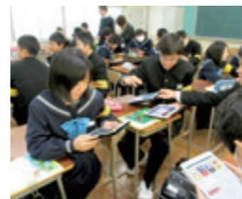
▲ウインタースクールの様子。大学教授の特別授業で、iPadを使って学び合う中学3年生。