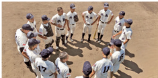
生徒の対話や主体性を重視した野球部の練習

暗記型の学びから脱して、新しい時代に求められる学力が身につく授業改善に取り組んでいます。パソコンなどの情報機器を活用したり、対話を重視する授業研究が行われています。