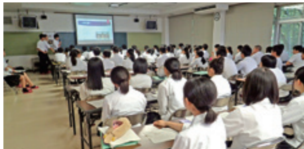
探究での研究成果をプレゼンする高校2年生

生徒が主体的・自主的に運営する部活動や、計画的な休養や科学的な練習方法を取り入れるなど、新しい時代に合った部活動に向けた改善に挑戦しています。