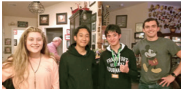
アメリカへの短期留学ホストファミリーとのひととき

生徒自身が課題を設定し、調査や実験を通して問題解決する探究活動を4年前から取り組んでいます。2020年からの大学入試改革にも完全対応しています。