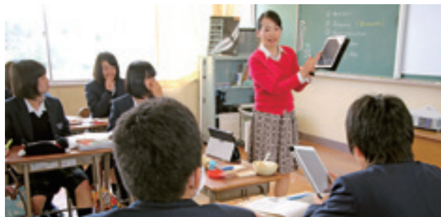
タブレット型パソコンやプロジェクターを活用した授業

高校教育が大きく変わります。2020年には、大学入試制度が大幅に改革され、成人年齢が18歳に引き下げられ、大学や短大などの高等教育の無償化も検討されています。このような大きな変化に備えて、丹生高校は様々な改善に挑戦しています。