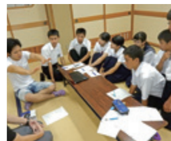
▲サマースクールの様子。4つの中学校から集まった連携生徒と、卒業生の先輩との交流。

中高一貫教育のメリット 中学校3年生から連携生徒の交流がスタートしますので、「高ギャップ」と呼ばれる人間関係の悩みやストレスがほとんどありません。しかも、進学を強く希望する意欲の高い仲間と4年間学ぶことで、自分の能力をグングン伸ばせます。 全国的にも、中高一貫教育が進学校の主流となっています。