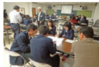
▲「小さな親切」運動に参加している地域の先輩と語る高校1年生。テーマは「越前町、こうなったら面白い！」

中高一貫教育のメリット 中学校3年生から連携生徒の交流がスタートしますので、「高ギャップ」と呼ばれる人間関係の悩みやストレスがほとんどありません。しかも、進学を強く希望する意欲の高い仲間と4年間学ぶことで、自分の能力をグングン伸ばせます。 全国的にも、中高一貫教育が進学校の主流となっています。