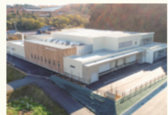
▲統合学校給食センター