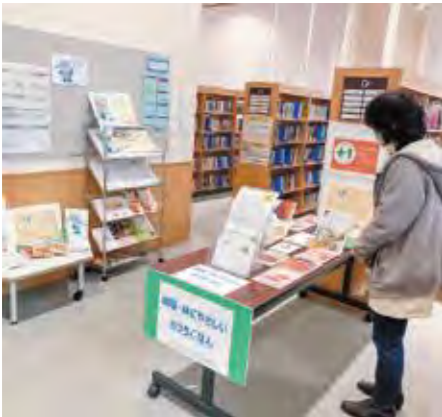
▲食生活改善コーナー

新型コロナウイルス感染症の影響により自宅で食事をする機会が増える中、2月15日から3月4日まで町立図書館宮崎分館において食生活改善コーナーを設置しました。町食生活改善推進員、町栄養士、図書館司書が連携し、野菜たっぷりレシピ、減塩食品、健康に関する本の紹介を行いました。来館者からは、毎日の食事を直すきっかけになったとの声があり生活習慣の改善に向け、がんばりたいと話していました。