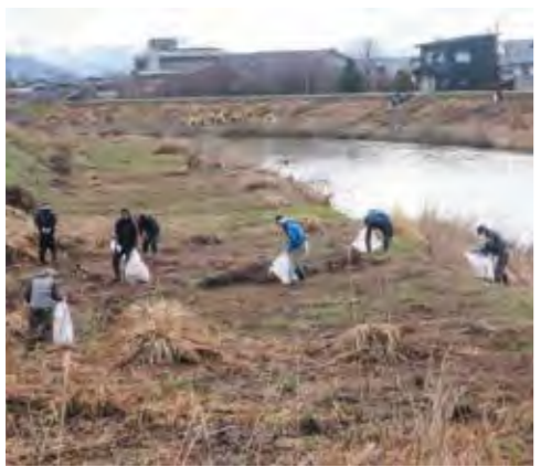
▲多くの人に参加していただきました

3月20日、朝日地区の河川周辺で、第48回天王川美化運動が行われました。メイン会場となる天王川流域では、近隣集落のみならずゴミ拾いや草刈りに汗を流しました。この活動を始めた頃から比べると、捨てられているゴミの量は減っているものの、空き缶や空きびんなど、大量のゴミが集まりました。美しい景観、住みよい環境を作るために、ゴミの投棄は絶対にやめましょう。