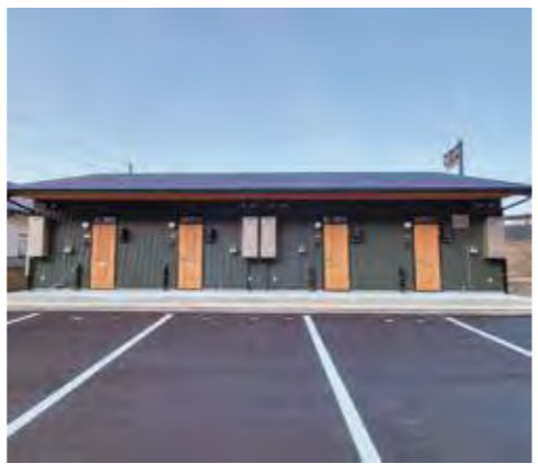
▲ラ・クリヤ（木造平屋建）

2月、越前地区厨地係に農林水産業従事者単身用住宅「ラ・クリヤ」が完成しました。この施設は、町内で農林水産業に従事する若手人材の確保および定住促進と生活の安定を目的に、一定期間の入居施設として貸し出されます。本年度からは、次世代の担い手を育成する水産カレッジ生などの卒業生を受け入れます。