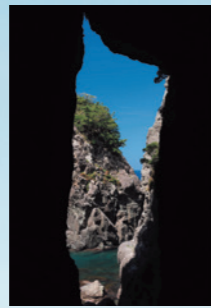
「房山トンネルの覗き岩」 早坂英介（福井県越前町）