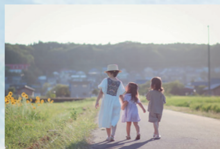
👑 特別賞 @ _ioak.m