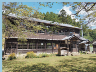
「標高300メートルの旧分校」 橋谷由香（福井県越前町）