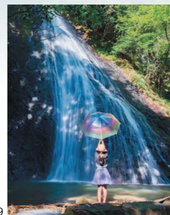
👑 準グランプリ @ hidekazu_photo0219