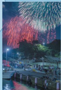
「越前みなと大花火」 橋本隆（福井県坂井市）