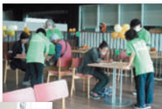
フレイルチェックの様子▶

心身が弱っていないかを確認する「フレイルチェック」や、椅子に座った状態で「つるかめ体操」を行いました。参加者からは「できることから始めたい」という声が聞かれました。