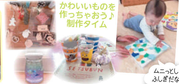
かわいいものを作っちゃおう♪制作タイム