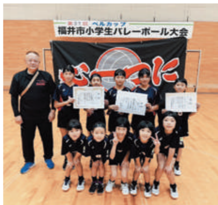
▲優勝した四ヶ浦バレーボールスポーツ少年団のみなさん