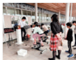
▲発電チャレンジの様子

「わくわくエコスクール」では、親子で地球温暖化と環境に配慮した未来のクルマなどのミニ授業を受けた後、発電した電気でモデルカーを走らせる実験を行いました。