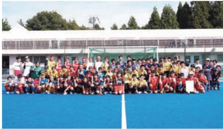
▲大会に参加した全チーム集合写真