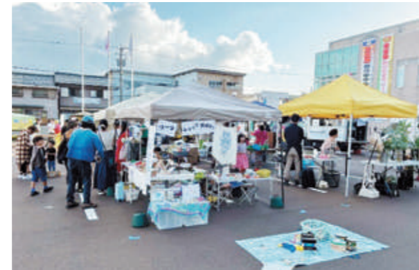
▲当日は合併20周年記念式典も開催されており多くの来場者で賑わいました

10月12日、役場駐車場で「越前町ココクルーマルシェ」を開催しました。キッチンカーやワークショップなど16店が集まり、多くの家族連れで賑わいました。当日は、「こすき発見！ロゲイニング」として、会場周辺に設置されたチェックポイントを制限時間内に徒歩でまわり、合計点数によって順位をつける競技を開催しました。ロゲイニングの参加者はポイントを探ぐために遠くのチェックポイントを目指し、汗を流していました。ココクルーは、町の魅力を発信するため、一緒に活動してくれる人を募集しています。