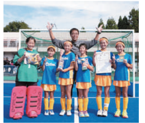
▲女子の部で優勝した朝日ホッケースポーツ少年団(女子)のみなさん