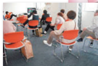
▶つるかめ体操の様子