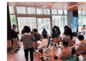
▲血管年齢測定、ベジチェックの様子

ベジチェックを受けた人からは、「普段から積極的に野菜を食べるように気を付けているが、今回良い数値が出てよかった」などの声を聞くことができました。