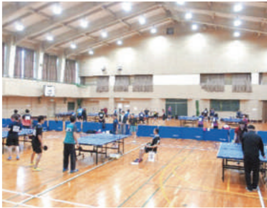
▲大会に臨む選手たちの様子