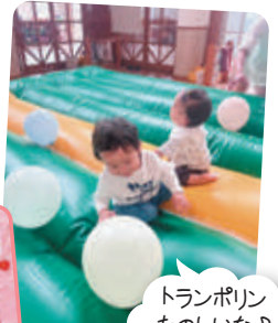
トランポリンたのしいな♪

★ 窓から海が見える、ゆったりとした雰囲気の子育て支援センターです♪ フォトブースでの写真撮影や、SNSに載っている話題のものを作ってみよう♪の制作タイムが人気で、いつもは静かな支援センターもイベントの日にはにぎやかです♡ 「やってみたくて、おうちではなかなか時間がないなあ」ということを、支援センターでできたらなと思い、一緒に楽しんでいます。ぜひ遊びにきてください♡