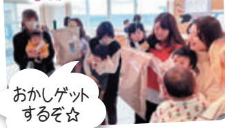
おかしゲットするぞ☆