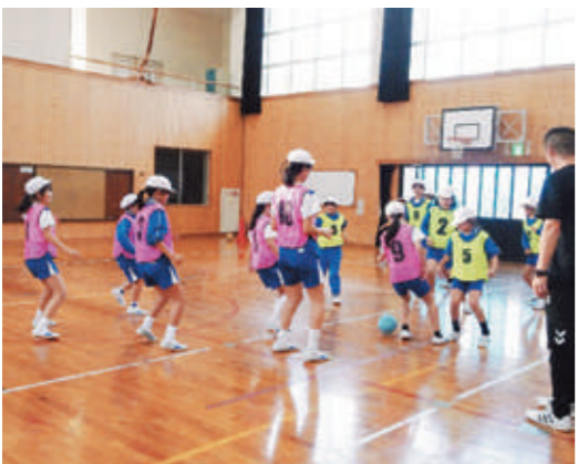
▲サッカー教室の様子

11月13日、福井ユナイテッド株式会社「キッズ応援プロジェクト サッカーしよっさ」の活動の一環として、福井ユナイテッドの選手とコーチが城崎小学校を訪れました。当日は、選手から「スポーツをする楽しさを感じてほしい」とサッカーボールが寄贈された後、4、6年生を対象にサッカー教室が開かれました。子どもたちは、チームプレーの重要性を教わり、「ドリブルやシュートがうまくできた」とたいへん喜んでいました。その他の小学校にもサッカーボールが寄贈されます。