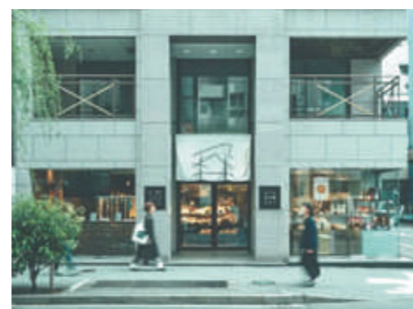
▲アンテナショップ「ふくい食の國291」

東京銀座にて「越前町フェア」を開催します！ 越前町商工会では、今年3月16日の北陸新幹線敦賀延伸という絶好のチャンスを活かすため、福井県のアンテナショップ「ふくい食の國291」にて「越前町フェア」を開催します。 より多くの人に越前町の魅力を伝えるため、関東圏の消費者と直接触れ合いながら、消費者ニーズに合った商品づくりやブラッシュアップを進め、商品の知名度向上を目指します。 期 日 12月14日(土)・15日(日) 場 所 ふくい食の國291 (東京都中央区銀座1-5-8)