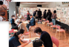
▲体組成測定、健康相談の様子