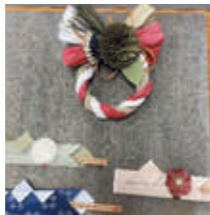
令和5年度実施時の様子▶