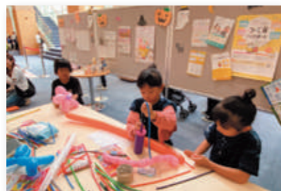
▲バルーンアートの様子

キッズコーナーでは、バルーンアートやハロウィンにちなんだ小物入れ作りを親子で楽しみました。また、育児相談や、子育て支援センターの活動の様子を紹介するパネルの展示も行いました。