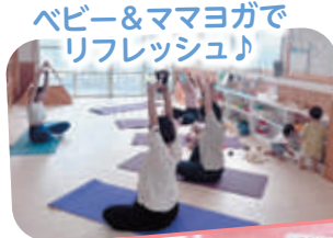
ベビー&ママヨガでリフレッシュ♪