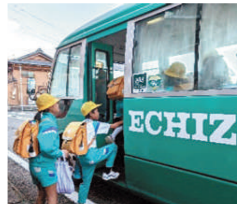
▲スクールバスに乗車する様子

来月4月の常磐小学校・朝日小学校および四ヶ浦小学校・城崎小学校の学校再編に向け、想定される運行ルートでスクールバスの試験運転を行いました。当日は、常磐小学校の児童は朝日小学校へ、四ヶ浦小学校の児童は城崎小学校へスクールバスで登校した後、それぞれの学校で交流活動を行いました。今後も試験運転を複数回行い、乗降時の安全や運行時刻などを確認し、4月からの運行開始に向けて準備していきます。