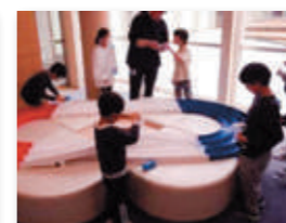
▲わくわくエコスクールの様子