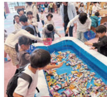
▲お菓子釣りの様子

10月20日、サンライズ織田で町子ども会主催の「越前町子どもまつり」が行われました。町内の小学生や中高校生のジュニアリーダーのほか、町子ども会役員など合わせて120名が参加しました。子どもたちは、輪投げや積み木ゲーム、お菓子釣りなどのゲームコーナーに挑戦し、両手に景品を抱え、とても嬉しそうなお祭り気分でした。また、参加者全員でじゃんけんゲームや風船送りなどにも挑戦し、最後はお楽しみ大抽選会で幕を閉じました。みんなに楽しんで笑顔になってもらおうと何度も打ち合わせをするなど、中高