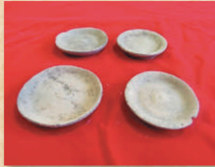
出土した土師器皿