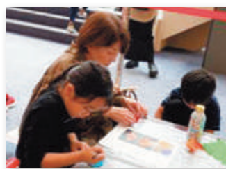
▲小物入れ作りの様子