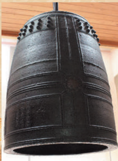
国宝 梵鐘(劔神社蔵)