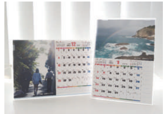
▲写真は昨年の絵はがきカレンダー

ご希望の方は、越前地域コミュニティ運営委員会事務局までお申込みください。 問合せ先 越前地域コミュニティ運営委員会 ☎ 37-7710