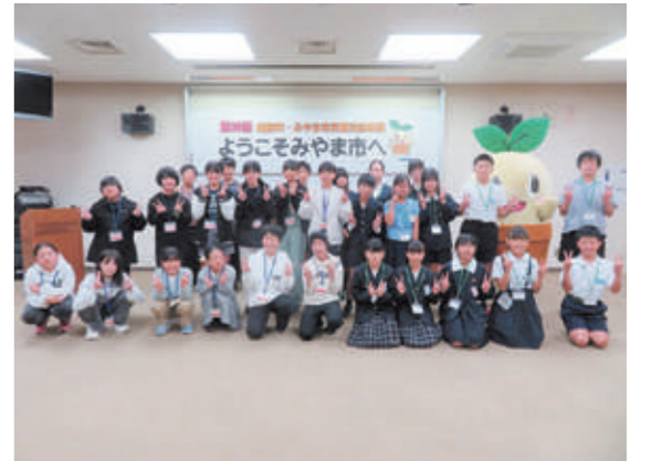
▲事業を通じて交流を深めた両市町の児童

11月1日～3日、越前町の児童14人が姉妹都市の福岡県みやま市を訪れました。この交流事業のきっかけは、旧朝日町発祥の「幸若舞」で、現在、この舞の原形はみやま市瀬高町の大江地区に残っています。1日目は、貴重な国産線香花火づくりを体験し、2日目には、みやま市の児童14人と一緒に、幸若舞の講話や先進的なリサイクル施設の見学、ボッチャなどを楽しみ、夜は宿泊体験をして交流を深めました。来年1月31日～2月2日には、みやま市の児童が越前町を訪れる予定です。