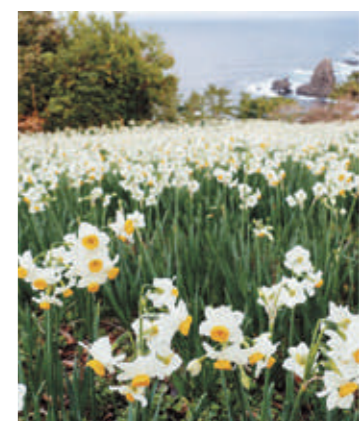
▲見ごろを迎えた水仙(昨年の様子)