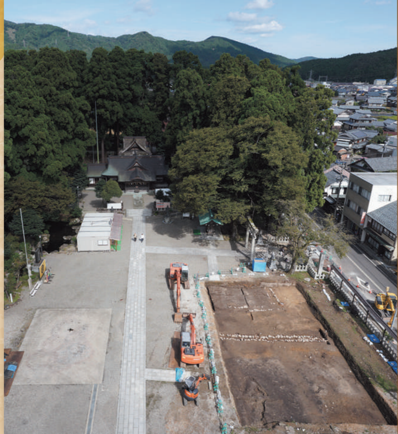
劔神社・座ヶ岳と杉の花遺跡