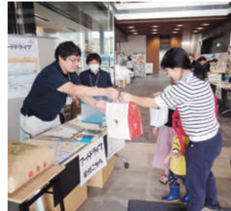
▲フードドライブに寄付していただきました

10月26日に開かれた「いきいき健康フェア」で、フードドライブを実施しました。ご来場いただいたみなさんから、お米や缶詰など、合計118点の食品を寄付いただきました。ご協力ありがとうございました。集まった食品は福祉団体を通じて必要としている人のために活用されます。次回のフードドライブは住民環境課窓口で、12月2日～6日に受付します。