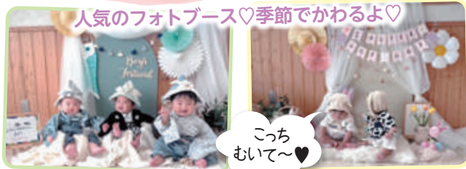
人気のフォトブース♡季節でかわるよ♡