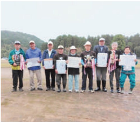
▲大会で入賞されたみなさん