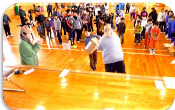
表彰式 おめでとうございます。