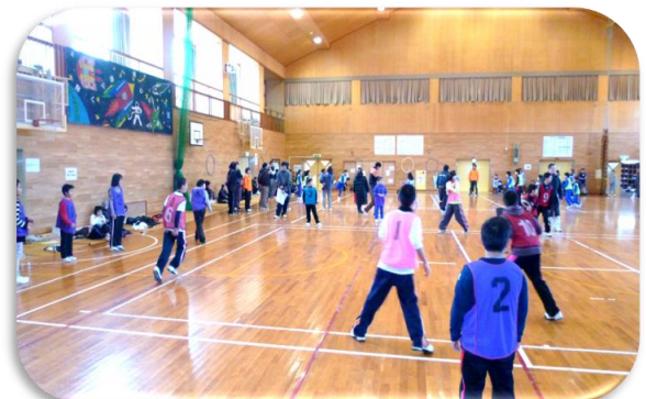
体育館の中は、熱気ムンムン