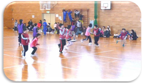
すばयी動きの子どもたち