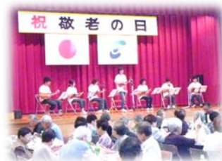
OTA ウクレレ クラス