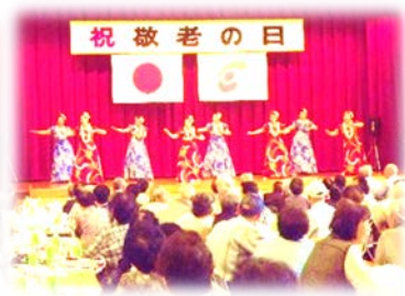
宮崎ハワイアンダンス・クワヒヴィ会