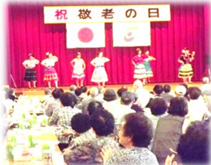
織田の宝塚ジェヌ チーム