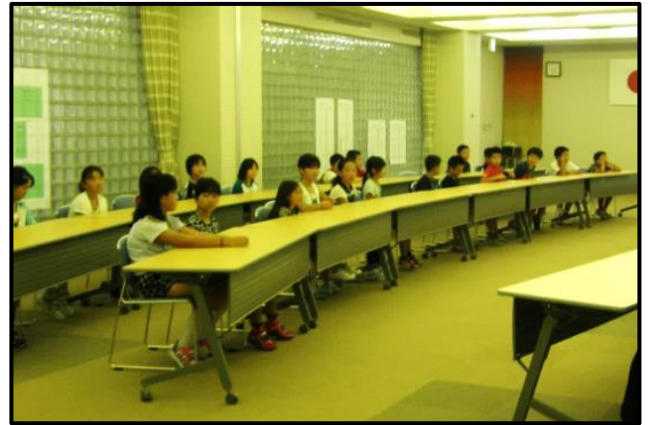
『開校式で1人ずつ自己紹介』

9月28日(日)から30日(火)までの3日間、越前コミュニティセンターで、四ヶ浦小学校・城崎小学校の4年生26人が参加して、合宿通学が行われました。参加した子どもたちは貴重な集団生活の中で、いろいろな事を学び、学校とは違った喜びや楽しさを感じていました。子どもたちを応援して下さった皆さん、ありがとうございました。