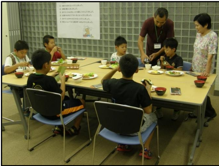
『みんなで食べるご飯はおいしいね♪』