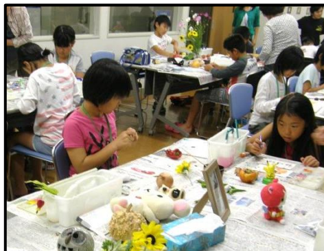
『絵手紙、上手に書けたよ!』