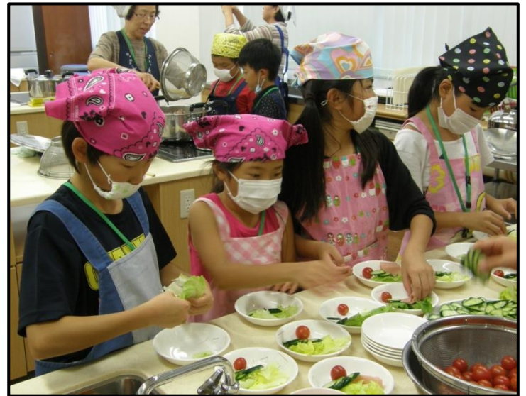
『2班に分かれて夕食づくりのお手伝い』