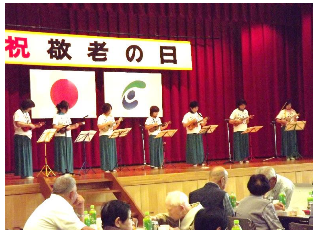
OTAウクレレクラスタ「見上げてごらん夜の星を」 「瀬戸の花嫁」 「上を向いて歩こう」