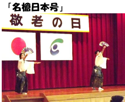
宗生流剣詩舞道会 織田