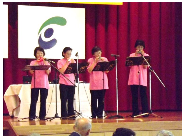
フジオカリ十教室「見上げてごらん夜の星を」 「愛の賛歌」「北国の春」