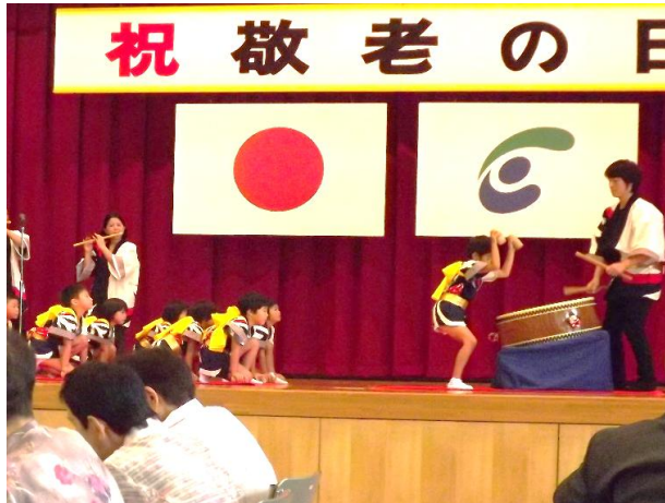
たいら保育園「だいずり」

9月11日(日)、サンライズ織田で敬老会が開催されました。今年には144名の参加があり、大変にぎやかな会となりました。ご出演いただきました皆様、ありがとうございました。