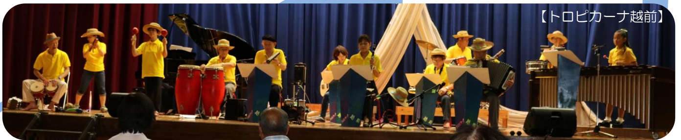
【トロピカーナ越前】

8月6日アクティブランド体育館で、越前町文化協議会越前美咲支部主催による、「第37回夏の陽の音楽祭」が開かれました。大正琴 越前水仙クラブ、アコースティックギターさくらんぼの会、尺八 楓の会、民謡 うぐいす会、トロピカーナ越前、越前町民混声合唱団丹生エコーズ、越前中学校吹奏楽部の7団体による音楽発表が行われました。「みんなでうたおう」のコーナーでは、「花笠音頭」を合唱し会場内の一体感を感じとることができました。また、越前中学校吹奏楽部の若さあふれる演奏後には、観客からの大きなアンコールの声援も飛び交い、最高のフィナーレで盛り上がりました。会場へ来られたみなさんも暑い夏の陽のひとときを音楽で癒されたのではないのでしょうか。