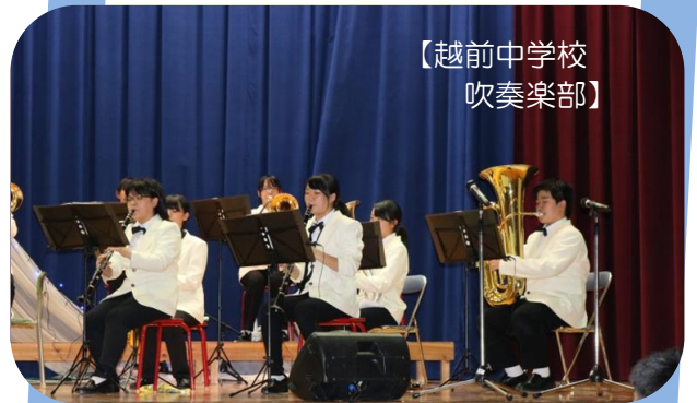
【越前中学校 吹奏楽部】