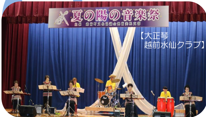
【大正琴 越前水仙クラブ】