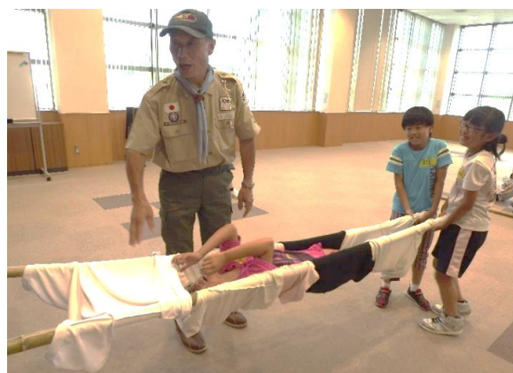
『Tシャツと竹の簡易担架で搬送訓練』