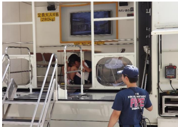
『起震車で、地震の怖さを体験』