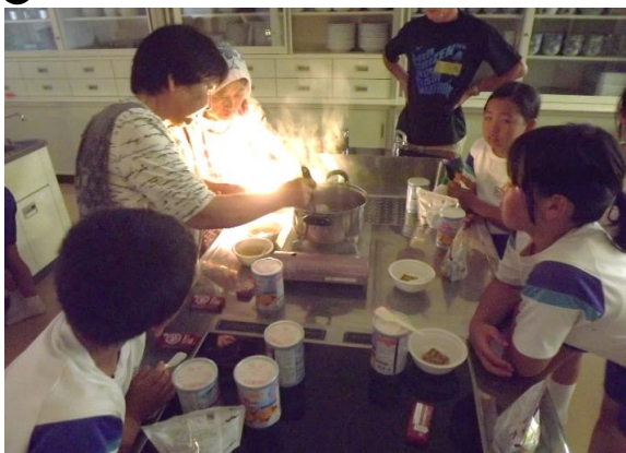
『アルファ米などの非常食で夕飯』

大阪地震や豪雨災害が発生したばかりの中、子供達は真剣に防災のことを学び、防災意識を持つきっかけになったのではないのでしょうか。