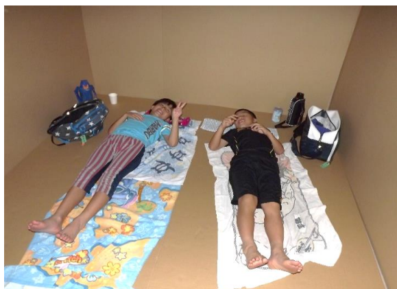
『段ボールで仕切ったスペースで就寝』