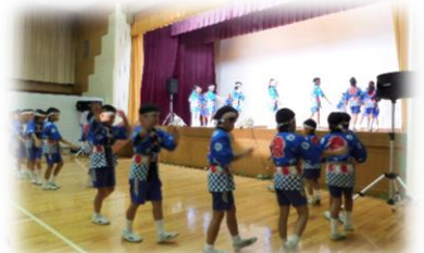
宮崎小学校4年生(宮崎音頭)