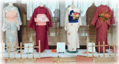
花むすびの会(着付け)