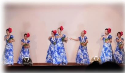
宮崎ハワイアンダンス・クワヒヴィ会