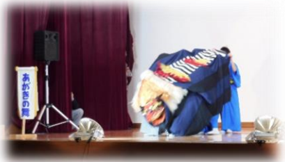
八田獅子舞保存会(子ども獅子舞)

11月3日・4日の2日間、宮崎コミュニティセンターで宮崎地区文化祭が行われました。文化協議会、老人クラブ、保育所、児童館、小学校、中学校、一般の皆さんより出品された作品はどれも力作揃いで、訪れた人の目を楽しませてくれました。舞台発表では宮崎中学校の吹奏楽部の「ウエルカムマーチ」を皮切りに、13団体が日頃の成果を十分に発揮し、会場は大きな拍手に包まれました。