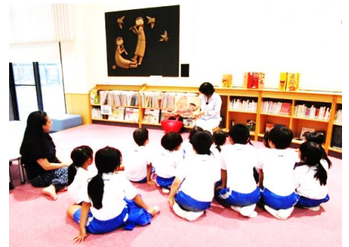
※昨年の「おはなし広場」の様子です。

今年度ももっと図書に関心を持っていただけるよう「こんな行事があったらいいな。」「こんな本の展示コーナーがあったらいいな。」などのご意見をお聞かせください。お待ちしております。