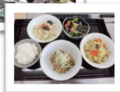
【脂肪燃焼料理教室】