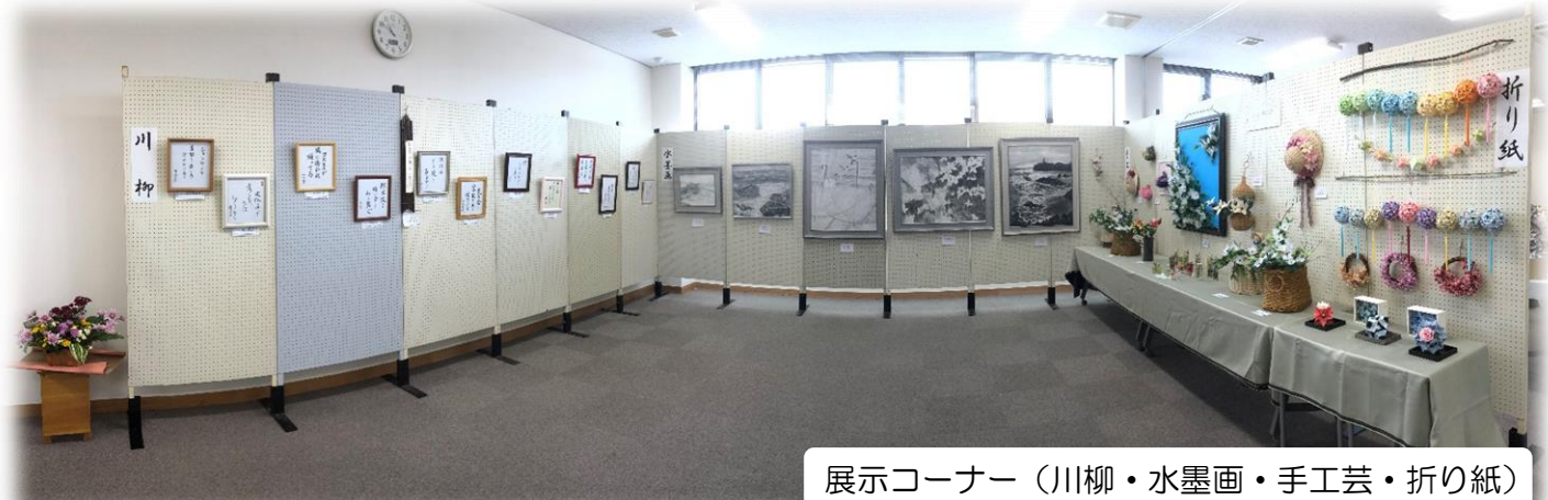
展示コーナー（川柳・水墨画・手工芸・折り紙）