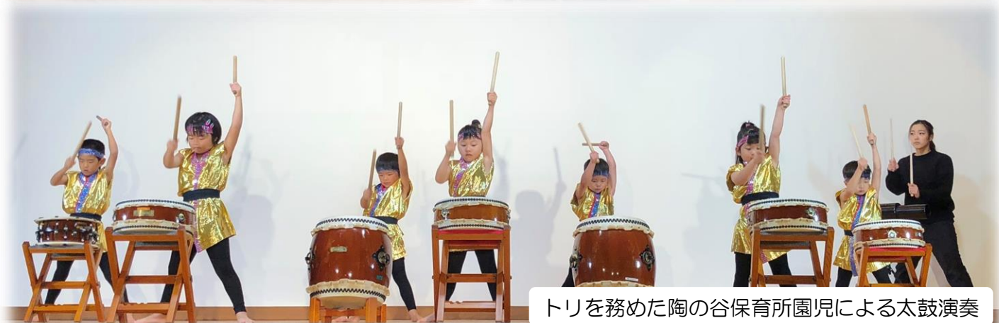
トリを務めた陶の谷保育所園児による太鼓演奏