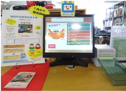
カウンターにある検索機

図書館には、越前町図書館にある資料（本・雑誌・視聴覚資料）を探ることができる検索機があります。その他にも検索機では、現在図書館で借りている本の書名・著者名・利用日が記載された読書シールを印刷することができます。シールを読書手帳に貼って読書の記録を残してみたいかたは、いかがですか。