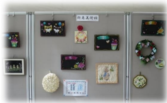
5月展示風景（手芸サークル紅花）

これからも会員のみなさんの素敵な作品が展示される予定です。センターへお越しの際は、ぜひご観覧ください。