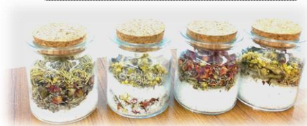
透明容器入りのバスソルト