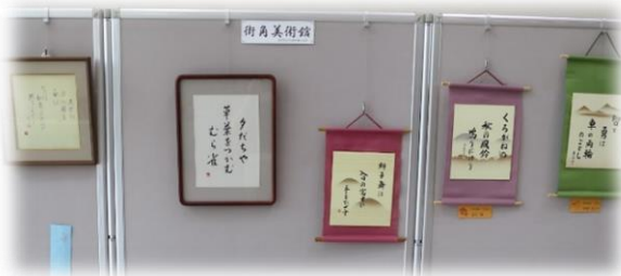
9月展示風景（玄潮歩書道会）

越前町生涯学習センターの玄関ホールでは、街角美術館と称し、越前町文化協議会朝日支部の団体が月替わりで作品を展示しています。センターへお越しの際は、ぜひご覧ください。