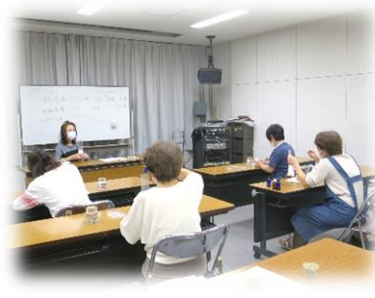
手づくりバスソルト講座