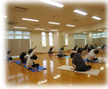
健康ストレッチ講座