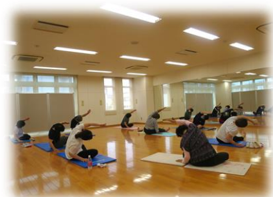
健康ストレッチ講座