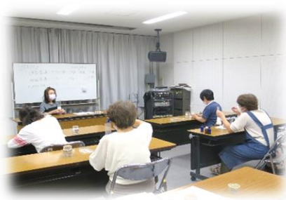
手づくりバスソルト講座