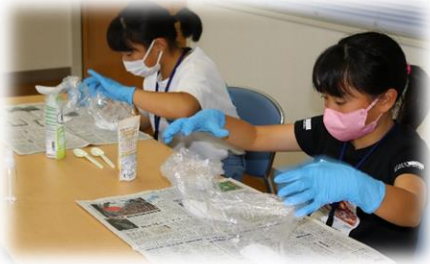
①重曹とクエン酸を混ぜます

今回はものづくり講座「バスボム（発泡しながら溶ける入浴剤）作り」を通して、生活の中にある身近な科学を学びました。