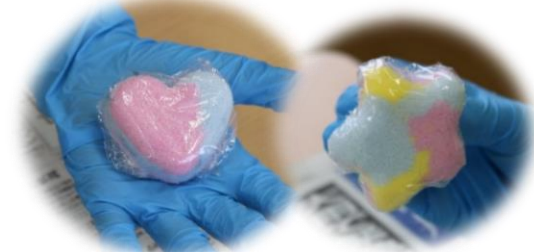
③抜き型等でハートや星にしたら かわいいバスボムのできあがり☆彡☆