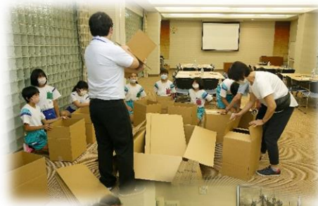
【段ボールベッドづくり】