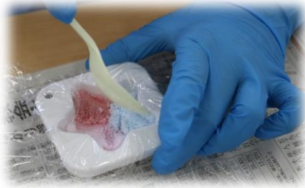
②混ぜた粉に水を加えて固め、色粉で色をつけます