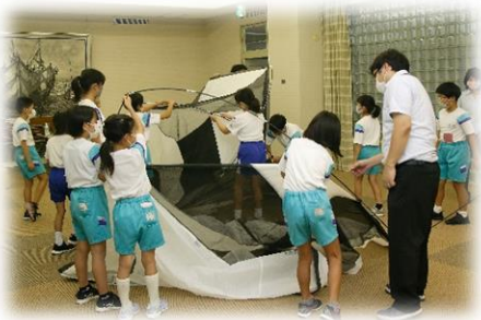
【防災テントづくり】

段ボールベッドの組み立てや、身の回りにあるものを使ってつくる応急担架づくりなど、地域ボランティアのみなさんのご指導の下、自分の手や身体で体験しながら楽しく学びました。