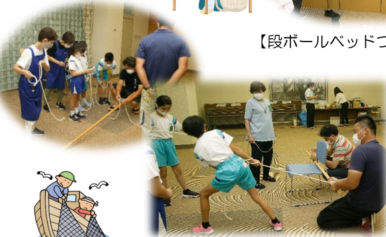
【ロープワーク体験】