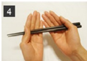
4 お箸の下で両手をそろえる