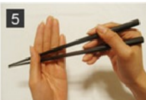
5 お箸を右方向に滑らせる