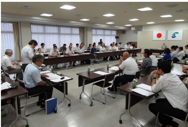
▼検討委員会の様子