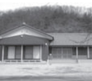
地区住民の交流拠点となる 金谷すみよし会館

●地区集会施設の整備支援 自治総合センターのコミュニティ助成金を活用し、金谷区集会施設の建設費を補助 2,260万円