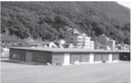
漁港の衛生環境の向上にも繋がる漁業用作業保管施設

●森林の適正な管理 森林施業のための現況調査費や造林、除間伐、作業路などの整備費を補助 982万9千円