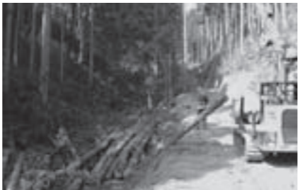
整備した作業路による森林施業

●水産環境の整備 漁業に関する普及啓発活動を行う町産地協議会の活動を支援 厨・米ノ地区の漁業用作業保管施設の整備費を補助 4,309万3千円