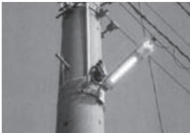
LED防犯灯 (気比庄地区)

●LED防犯灯の設置支援 区が管理する既存防犯灯のLED防犯灯への取替費を補助 4,599万1千円