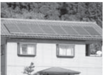
住宅屋根に設置された太陽光発電設備