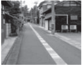
消雪設備が整備された町道 (西田中地区)

●安全な交通の確保 社会資本整備総合交付金を活用し、福井線などの歩道整備、北乙坂線などの路面舗装、宮前線・馬場高橋線などの消雪設備整備を実施 2億2,761万2千円