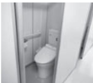
洋式化された校舎トイレ (城崎小学校)

●学校空調設備・トイレの整備 町内すべての小学校の4年生から6年生までの教室に空調設備を整備 朝日・常磐・糸生・城崎・萩野小学校と宮崎・織田中学校の校舎トイレを洋式化と乾式化に改修 2億2,156万1千円