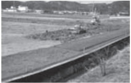
水量を適正に管理するための暗渠排水

●農業施設の整備 上川去、気比庄、田中で暗渠排水や用排水路改修を実施 5,653万8千円