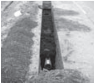
公共下水道につなぐ管路の布設

●下水道施設の統合 宮崎東部(八田・陶の谷)処理区と上戸処理区を公共下水道(朝日浄化センターで汚水処理)につなぐ管路を布設 3,143万4千円