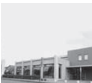
朝日コミュニティセンター

●地域コミュニティ活動拠点の整備 旧武生公共職業安定所朝日出張所を朝日コミュニティセンターとして整備 2,449万6千円