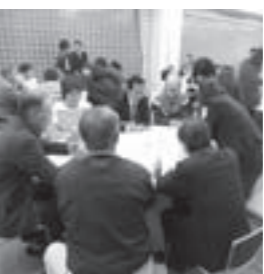
住民が参加し空き家利用について話し合うワークショップ

●集落振興の支援 地域の課題を掘り起し、活性化を図る担い手として活動する地域おこし協力隊を雇用 高齢化が進む集落の維持・活性化を支援する集落支援員を配置 480万1千円