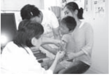
乳幼児の予防接種(織田病院)

●予防接種の奨励 乳幼児の感染症や高齢者のインフルエンザなどを予防するため、予防接種を実施 先天性風しん症候群の発生を予防するため、風しん予防接種費用を助成 3,674万円