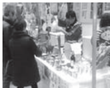
県外での出向宣伝

●観光資源のPR 県内外への出向宣伝を実施 観光PR・ポスターを作成し、高速道路サービスエリアに配置 1,255万6千円