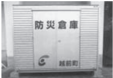
避難物資を備えた 防災備蓄倉庫(朝日小学校)

●避難所の充実 拠点避難施設となる朝日・常磐・糸生小学校に防災備蓄倉庫を整備 4,255万2千円