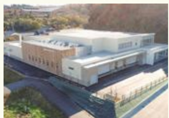
▲統合学校給食センター