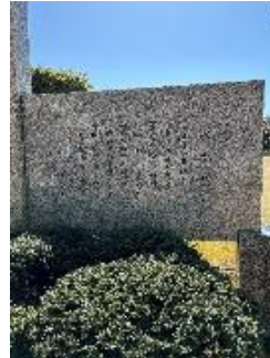
校歌 PTA 寄贈