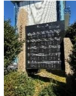
四ヶ浦中校歌 卒業生寄贈