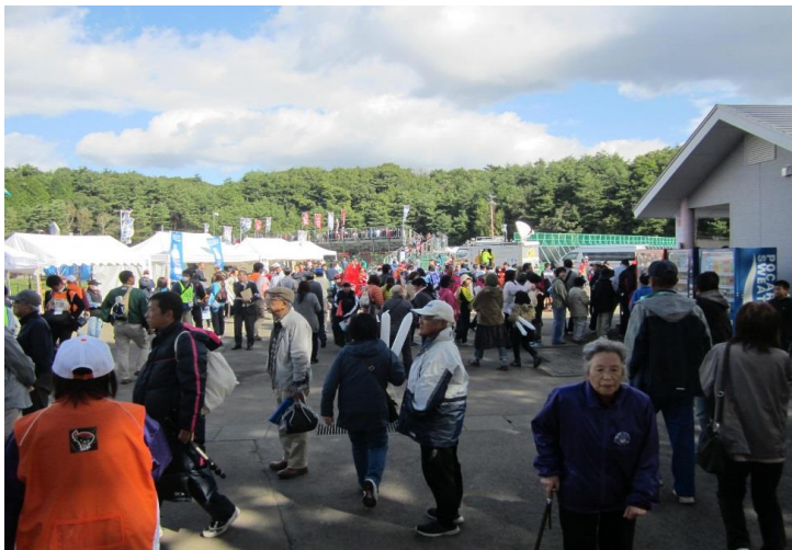
【競技会場来場者状況】