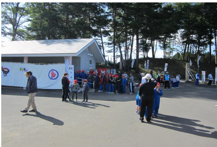
《女子トイレ数》 岩手は2ヶ所