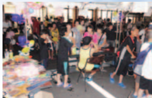
～みんなでつくる地域コミュニティ～ (宮崎地域コミュニティ運営委員会によるみやざき夏まつり)

平成23年度の一般会計、特別会計、企業会計を合わせた歳入総額は221億7,796万9千円で、前年度より9億2,833万4千円の減少、歳出総額は209億5,473万7千円で、前年度より12億8,065万2千円の減少となりました。歳入総額から歳出総額を差し引いた収支は、12億2,323万2千円の黒字となりました。