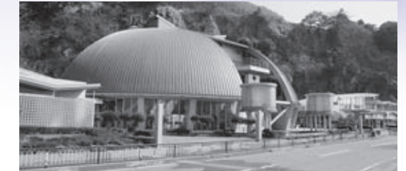
越前がにミュージアム

漁業の人材育成と観光の振興のため越前がにミュージアムの改修や、農林業の担い手と商工業の起業・創業支援により、将来にわたって引き継いでいける農林水産業・商工業の担い手の育成を図ります。