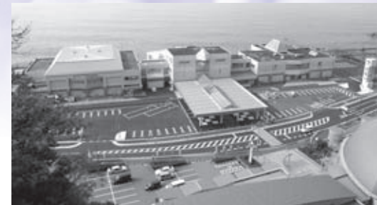
昨年オープンした道の駅「越前」

「観光立町」を目指し、道の駅「越前」を核とした観光客の誘客拡大により、観光産業を育成し、越前ブランドを活かした賑わいのある観光の活性化を図ります。