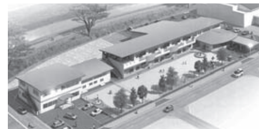
朝日地区統合保育所と朝日児童センター 完成予想図

朝日中央・朝日北保育所の朝日地区統合保育所と朝日児童センターの整備や、第3子以降の保育料の小学校入学前までの無料化などにより、笑顔で安心して子どもを産み育てられる子育て支援の充実を図ります。