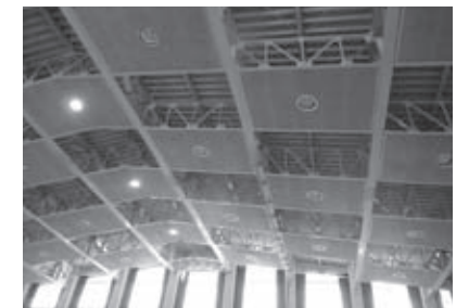
吊り天井となっている朝日小学校体育館

小中学校体育館などの吊り天井や照明の落下を防止する改修を行い、地震に対する児童生徒の安全を確保します。