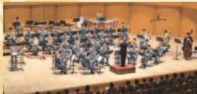
▲昭和34年に発足し、愛知県守山駐屯地を拠点に、東海北陸6県の防衛・警備を担当する第10師団の音楽隊として、管内各地で演奏活動を行っています。プロの音楽を楽しみながら、普段つながらの少ない自衛隊とふれあうまとな機会です。