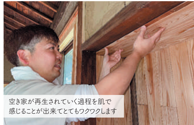
空き家が再生されていく過程を肌で感じる事が出来るととてもワクワクします