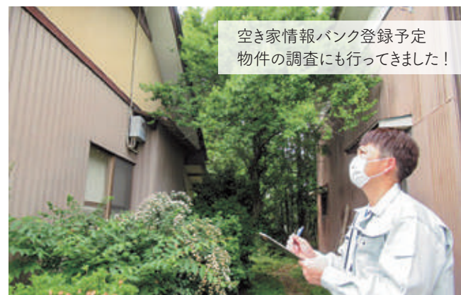
空き家情報バンク登録予定物件の調査にも行ってきました！