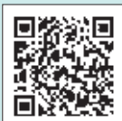
▲空き家住まい支援事業

移住者等が空き家情報バンク登録物件を賃借または購入して居住する場合に購入や改修の一部を補助します