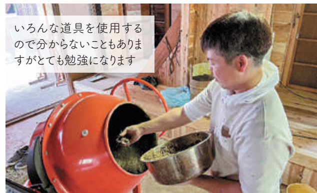
いろんな道具を使用するので分からないこともありますが大変勉強になります