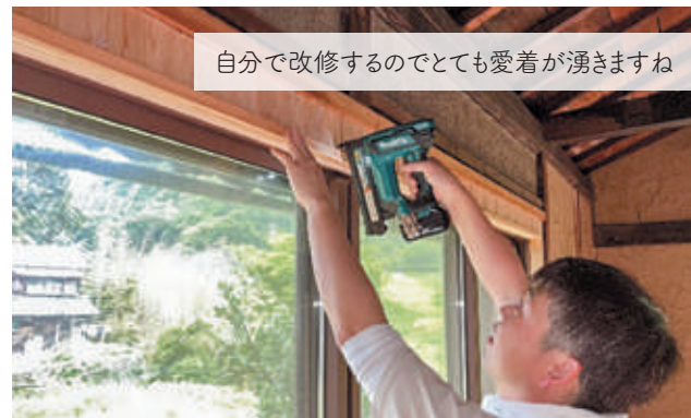
自分で改修するのでとても愛着が湧きますね