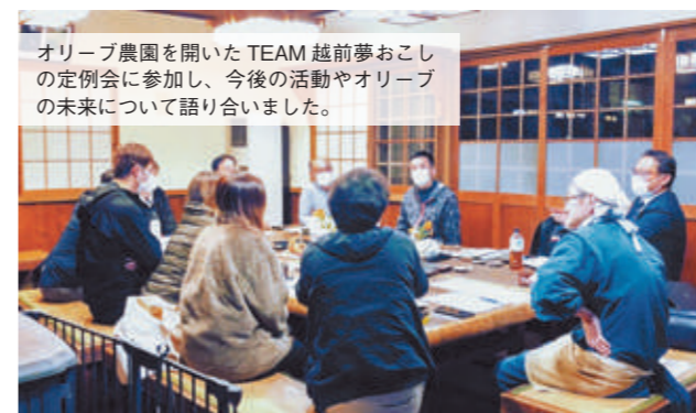
オリーブ農園を開いた TEAM 越前夢おこしの定例会に参加し、今後の活動やオリーブの未来について語り合いました。

総務省が行う取り組みで、地方に都市部の人材を受け入れ、地域協力活動を行うことで、地域の活性化を図りながらその地域に定住・定着を目指す制度です。本町では、平成25年度から「地域おこし協力隊」を導入し、過疎地域の活性化、地域の情報発信、観光面などで、地域力向上に努めています。