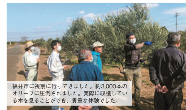
福井市に視察に行ってきました。約3,000本のオリーブに圧倒されました。実際に収穫している木を見ることができ、貴重な体験でした。