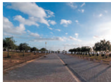
▲チュニジアではオリーブが身近にあります

チュニジアはオリーブ栽培が盛ん。郊外にはオリーブ畑が広がり、各家庭にはオリーブオイル専用の窯があって、家庭やレストランでの食事には必ずオリーブオイルが出てきました。