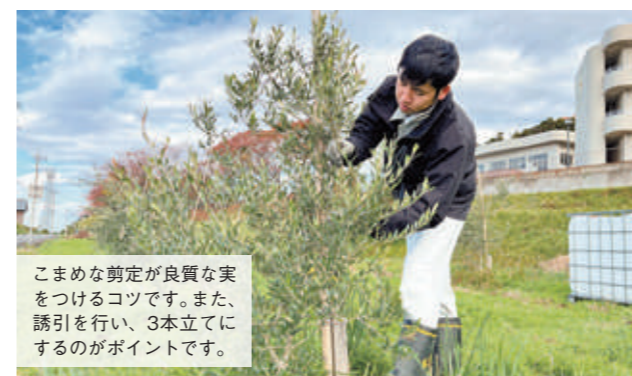
こまめな剪定が良質な実をつけるコツです。また、誘引を行い、3本立てにするのがポイントです。