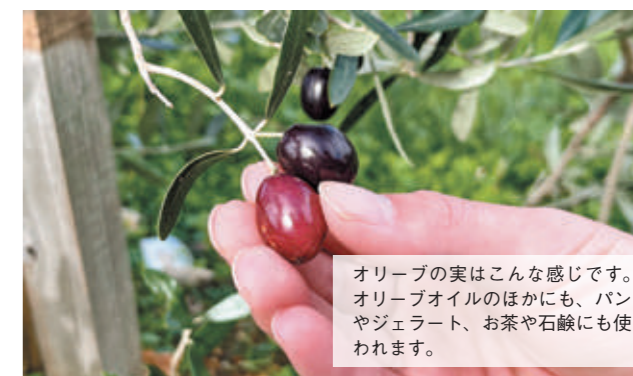
オリーブの実はこの感じです。オリーブオイルのほかにも、パンやジェラート、お茶や石鹸にも使われます。