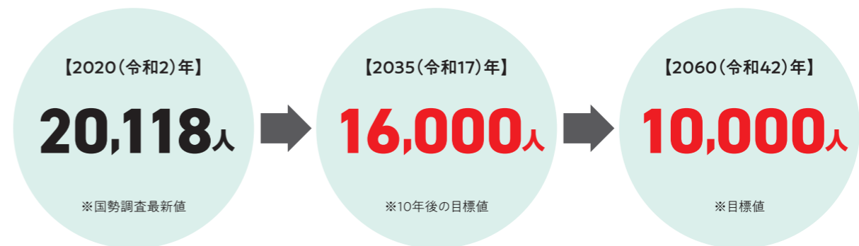
【社人研推計と越前町独自推計の比較】

2026（令和8）年越前町人口ビジョンにおいて、目標人口の見直しを行い、2035（令和17）年の目標人口を16,000人、2060（令和42）年の目標人口を10,000人と設定しました。