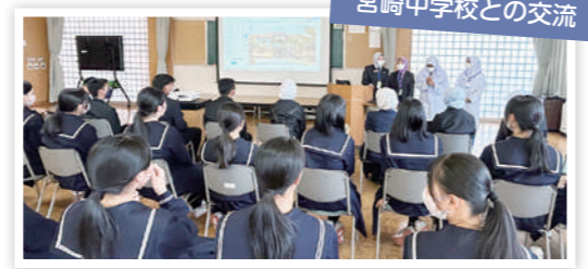
問合せ先 国際交流室 ☎34-8713

昭和32年:日本とマレーシア(当時マラヤ連邦)が外交関係を樹立。 昭和57年:マレーシアで「ルックイースト政策」提唱。 人材育成を通じた交流が本格化。 平成26年:越前町がマレーシア政府機関の海外研修地に選定。 ここから町との交流がスタート。 令和7年:マレーシアのエリート学校・私立学校の生徒が来町し、町内生徒と交流。 令和9年:越前町国際交流協会による初の「マレーシア派遣事業」を実施予定。