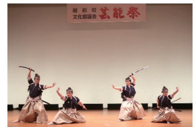
▲過去の芸能祭の様子