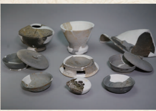
▲小柏窯跡出土品（須恵器）

かけて調査を行いました。再調査の結果、瓦当文様の特徴から近江の湖東地域の渡来系氏族との深い関係がうかがえること、現段階では、湖東地域以外では湖東式の軒丸瓦・軒平瓦がセットで見つかっていないこと、そして瓦だけでなく、須恵器も仏教需要をめぐる古代の地域間交流を見るうえで重要であることを確認しました。これらのことから福井県指定文化財としてふさわしいと審議されたようです。 E子 大変貴重な遺物なのですね。 学H その通り福井県内では非常に珍しい遺物といえるでしょう。 織田文化歴史館では、小柏窯跡出土品が福井県指定文化財に指定されたことから、常設展示中の小柏窯跡出土品をリニューアルしました。是非お越しください。