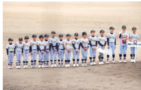
▲優勝した越前ニューヒーローズスポーツ少年団のみなさん