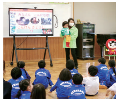
▲小学校での「人権教室」

※入院、入所などの理由により県内指定医療機関で受けることができない人は、健康保険課までお問い合わせください。 接種期間 誕生日前日〜翌年の誕生日前日まで 自己負担額 5,500円 接種場所 県内の指定医療機関は町ホームページでご確認ください 問合せ先 健康保険課 ☎34-8710