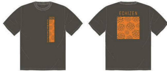
▲チャコール×オレンジ