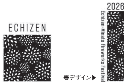
裏デザイン▶▶▶ 表デザイン▶▶▶

「越前みなと大花火」オリジナルTシャツを販売します 7月18日(出)に行われる越前の夏の風物詩「越前みなと大花火2026」この海と、40回目の夏。」にあわせて、実行委員会がオリジナルTシャツを製作・販売します。 今年も子ども用から大人用まで、豊富なサイズをご用意しました。 花火会場で着用して、記念すべき40回目の夏と一緒に盛り上げましょう！ サイズ・販売価格 110〜2L 1,500円(税込) 3L・4L 1,800円(税込)