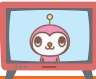
こしの都ネットワークキャラクター けーぶるん