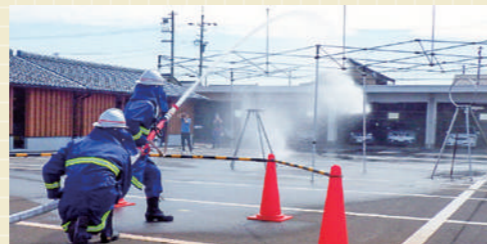
▲令和7年度の訓練風景