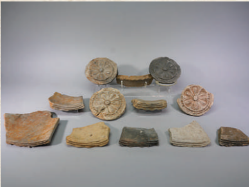
▲小柏窯跡出土品（軒丸瓦・軒平瓦）

学H 小柏窯跡出土品は発見されてから調査・研究が行われていましたが、改めて福井県教育委員会と越前町の教育委員会で数年