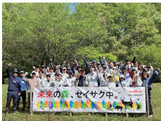
▲参加したみなさんで集合写真

活動後には、新緑の園内を回りながらモルックやリングゴルフなどのレクリエーションを楽しみ、交流を深めました。町民のみなさんも、緑豊かな「ムラタの森 水上山」へぜひ一度足を運んでみてください。