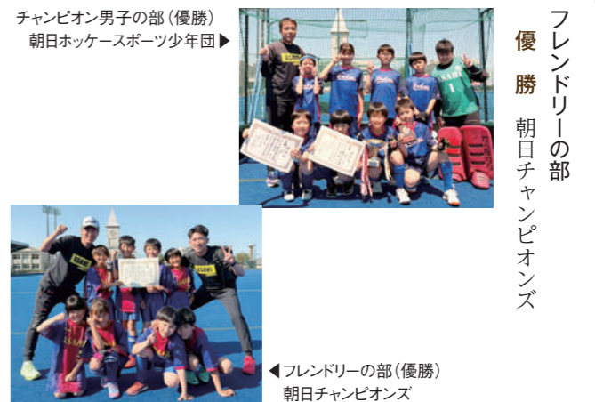
チャンピオン男子の部(優勝)朝日ホッケースポーツ少年団▶

チャンピオン男子の部 優勝 朝日ホッケースポーツ少年団 準優勝 えちぜんホッケースポーツ少年団 チャンピオン女子の部 第3位 えちぜんホッケースポーツ少年団