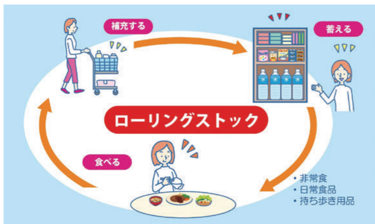
引用：政府広報オンライン「今日からできる食品備蓄。ローリングストックの始め方」