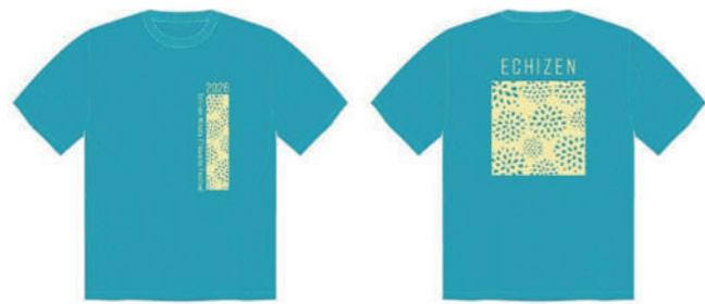
▲ターコイズ×イエロー