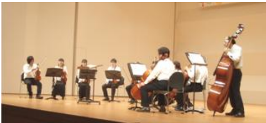
えちぜん弦楽アンサンブル

「2013 越前町音楽祭」が11月23日、越前町朝日多目的ホールで行われました。町内からは、えちぜん弦楽アンサンブルをはじめ、楓の会（尺八）、越前町民混声合唱団が出演しました。フィナーレを飾ったのは、四つ子のきつねによるサクソ四重奏団「サキシフォックス」で、「ルパン三世のテーマ」や「マンボNo.5」を演奏しました。アルト・テナー・バリトンサクソから流れるムーディで魅力的な音色に会場の皆さんは魅了され、訪れた人たちにとって素敵な休日のひとときとなったようです。