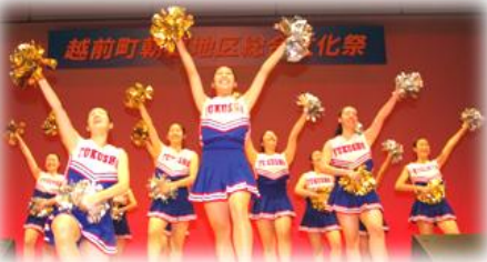
大盛況だった JETS の舞台発表

3日に行われました芸能発表会では、日頃の練習の成果を発揮しようと朝日地区文化協議会加盟団体や福寿会、福井商業高等学校チアリーダ部 JETS（ジェッツ）の16団体が参加しました。JETSは、会場の皆さんに簡単な踊りや掛け声を教えて、ステージと客席が一体となった楽しいステージをプレゼントしてくれました。また、最後には、全米で3回目の優勝を果たした素晴らしいダンスを披露し、会場を魅了しました。JETSの皆さんありがとうございました！