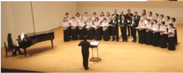
越前町民混声合唱団