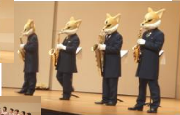
サキシフォックス