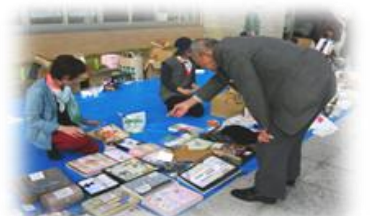
大盛況だったフリーマーケットやバザーの様子

3日に行われましたフリーマーケットでは、朝日地区婦人会が東日本大震災被災者支援バザーも併せて実施しました。地区の皆さまから多数の物品を提供いただき、お陰様で16,383円の売り上げがありました。売り上げは、越前町共同募金委員会を通して寄付させていただきました。皆さまのご協力ありがとうございました。