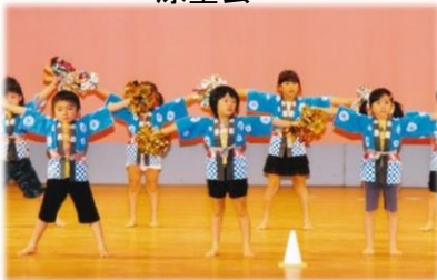
宮崎中央・小曾原保育所