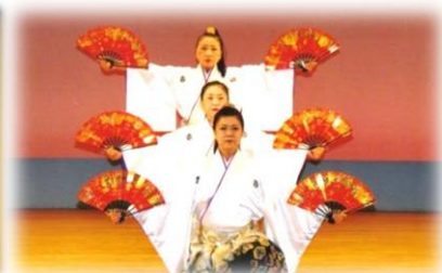
宗生流吟剣詩舞 宮崎教室