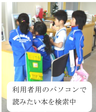
利用者用のパソコンで 読みたい本を検索中

「理想の間取りを手に入れたナチュラルスタイルの家」 「大人になったら、着たい服 2014 秋」 「文章力の決め手 - 短文から長文まで、もっと伝わ る 60 のテクニック」 阿部紘久 「地域ブランドのつくりかた - 47 都道府県ご当地 アイドル入ってます。」