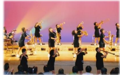
宮崎中学校 吹奏楽部

【囲碁大会】(11月2日:宮崎コミュニティセンター) 入賞者の皆さんおめでとうございます。