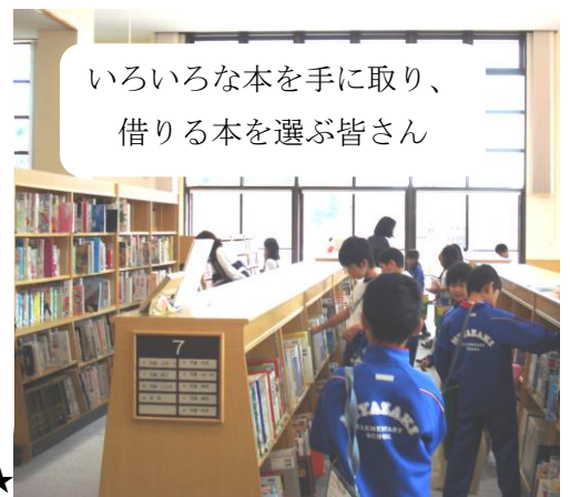
いろいろな本を手に取り、 借りる本を選ぶ皆さん