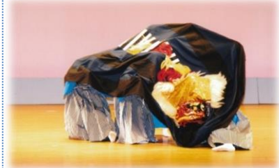
八田子ども獅子舞