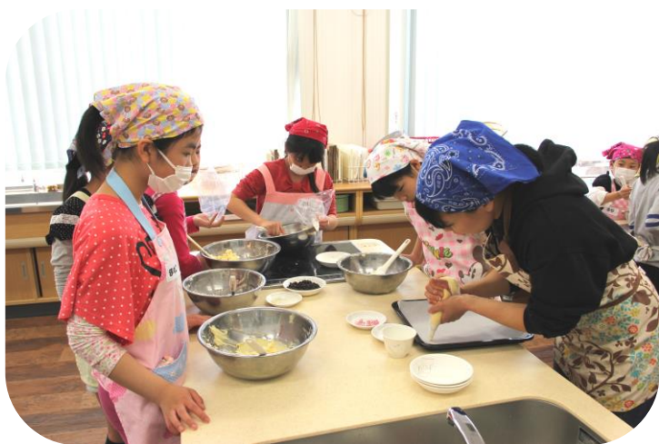
料理教室(小学4~6年生対象・月1回)