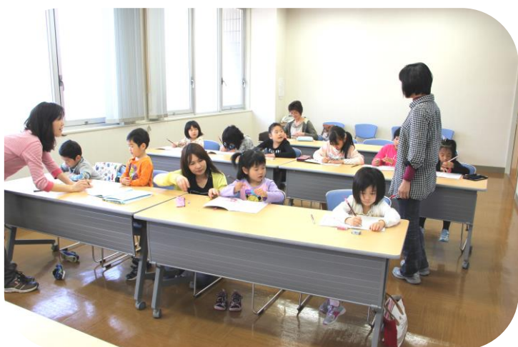
ペン習字教室(保育園年中~小学生対象・月2回)