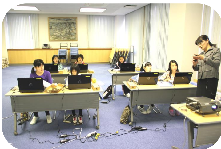
パソコン教室(小学5、6年生対象・月2回)