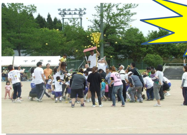
昨年の体育祭の白熱した様子